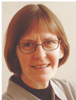
prorektor Gabriella Åhman

Jag vet av lång erfarenhet att den stora majoriteten varje dag vill göra sitt bästa för att ge studenterna den utbildning de förtjänar och har rätt att kräva. Jag vet också att många av de system vi byggt upp ibland är rent kontraproduktiva – de hindrar lärarna att fullgöra sin uppgift istället för att hjälpa dem. Alla de nyordningar som introduceras, det kan gälla resursfördelning, principbeslut vad gäller fördelning av forskningsmedel eller besparingsplaner kan