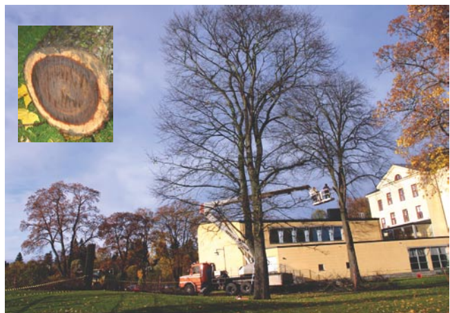
De tre träden var samtliga drabbade av långt framskriden röta (infällda bilden) med endast någon centimeter frisk ved och därmed en fara.

Det började som en utglesning av almarnas grenverk men slutade med total avverkning.