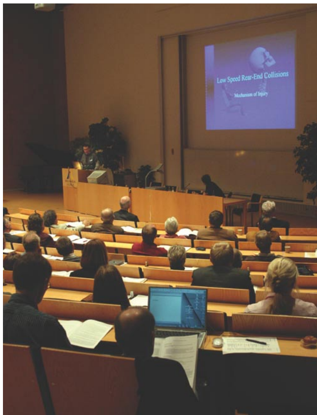
Whiplash är inte alltid bara en mekanisk skada som kan repareras med en mekanisk operation. Ibland krävs helt andra metoder. Det har forskarna vid Belastningsskadecentrum funnit. Flera av metoderna delgavs läkarna vid den internationella kongressen.

Forskarna vid BSC har sett bortom den faktiska skadan, till exempel en skadad eller