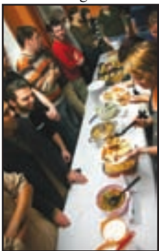
Den internationella buffén blir succé varje år.