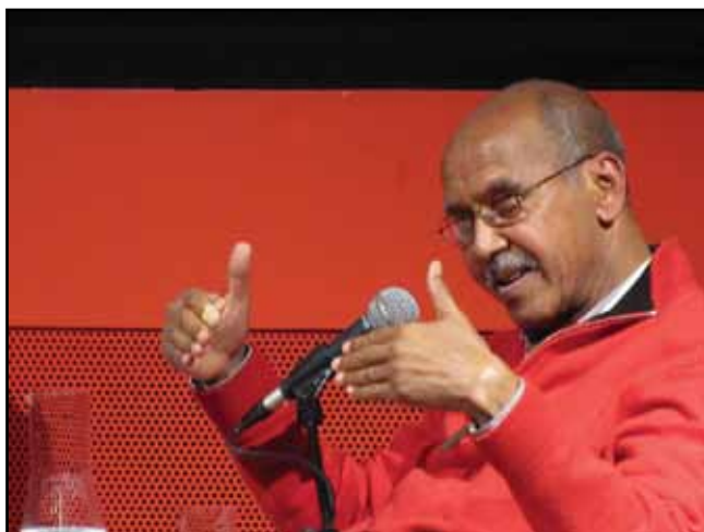
Cees Nooteboom (övre bilden) och Nuruddin Farah.

– Jag har inget ärende, säger AS Byatt. En polemisk artikel gör nog mer nytta än det jag skriver. Jag ser det mer som tur om någon hittar något i mina böcker och jag skriver inte engagerat utan av kärlek till språket.