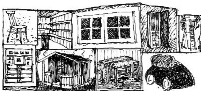
Teckning: Jan Eriksson

Det är i allmänhet svårt att rekrytera studenter till teknikutbildningarna och i synnerhet kvinnliga studenter – men vad är det då som gör detta program så framgångsrikt. En sak är att ”design” verkar lockande för många. Jag är inte särskilt förvånad över att det är så många